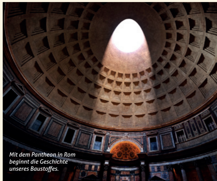
Mit dem Pantheon in Rom beginnt die Geschichte unseres Baustoffes.

Die Blähton Wandelemente von ROSTOW beruhen auf dem gleichen Prinzip wie die Kuppel des Pantheons, doch nutzen wir heute statt Tuff- und Bimsstein den modernen Zusatzstoff Blähton. Für die Veredelung dieses schon lange in