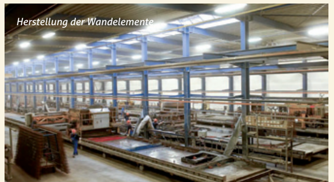
Herstellung der Wandelemente

Auch Sie können von den vielen Vorteilen unserer Bauweise profitieren und in den Genuss des Rostow-Wohlfühlfaktors kommen. Wenn Sie mehr über unsere Häuser erfahren möchten, die die Vorzüge einer traditionellen Bauweise mit den ingenieurtechnischen Errungenschaften eines modernen Hochleistungsbaustoffes in Perfektion kombiniert, dann rufen Sie uns einfach an. Gerne zeigen wir Ihnen bei einem unverbindlichen Termin, Materialproben „zum Anfassen“ oder vereinbaren eine Hausbesichtigung für Sie. Wir freuen uns auf Sie.