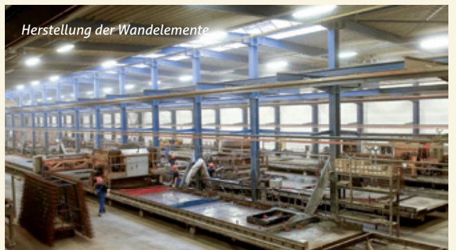
Herstellung der Wandelemente

Auch Sie können von den vielen Vorteilen unserer Bauweise profitieren und in den Genuss des Rostow-Wohlfühlfaktors kommen. Wenn Sie mehr über unsere Häuser erfahren möchten, die die Vorzüge einer traditionellen Bauweise mit den ingenieurtechnischen Errungenschaften eines modernen Hochleistungsbaustoffes in Perfektion kombiniert, dann rufen Sie uns einfach an. Gerne zeigen wir Ihnen bei einem unverbindlichen Termin, Materialproben „zum Anfassen“ oder vereinbaren eine Hausbesichtigung für Sie. Wir freuen uns auf Sie.